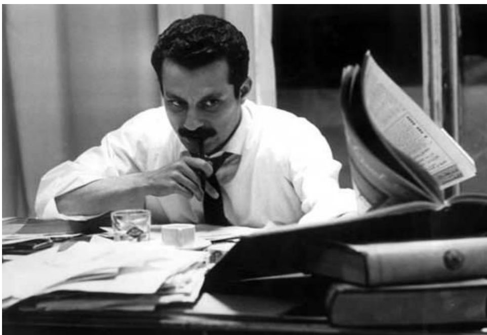
Ghassan Kanafani var en anerkendt journalist i Libanon i 1960'erne.

Ghassans karriere skred fremad, han fik libanesiske statsborgerskab og blev i 1963 chefredaktør for et af Libanons største dagblade. Samtidig udgav han bøger og skrev teaterstykker, og han blev efterhånden stadig mere involveret politisk.